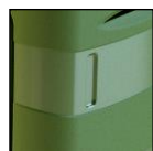
Maniglie laterali e posteriore per facilitare la movimentazione