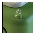
Ganci per sollevamento