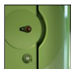
Chiavistello con segnalazione libero/occupato + chiusura con chiave