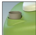
Condotta di sfiato