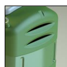
Finestrelle per areazione

Colori standard: Verde (RAL simil 6025), Blu (RAL simil 5017). Altri colori su richiesta; possibilità di personalizzazione con pellicola decorativa adesiva.